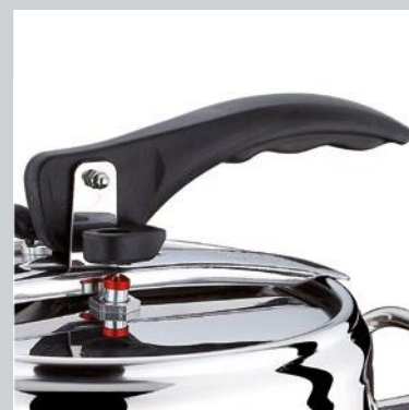
MANICO ERGONOMICO ERGONOMIC HANDLE