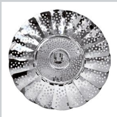
CESTELLO CUOCIVERDURE VEGETABLE STEAMER BASKET