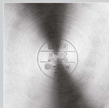
TRIPLO FONDO A INDUZIONE TRIPLE INDUCTION BOTTOM