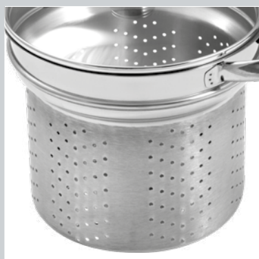
CESTELLO IN ACCIAIO INOX BASKET IN STAINLESS STEEL