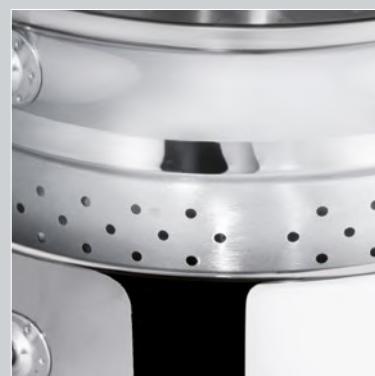
CESTELLO INOX 18/10 18/10 ST. STEEL BASKET