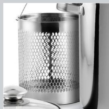
CESTELLO IN ACCIAIO INOX STAINLESS STEEL BASKET