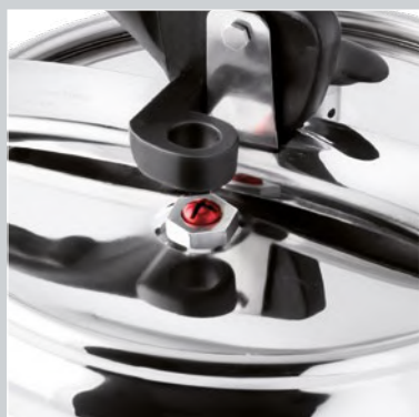
VALVOLE DI SICUREZZA SAFETY VALVES